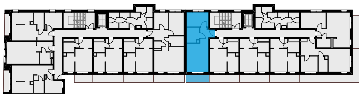
RZUT MIESZKANIA SKALA: 1:75